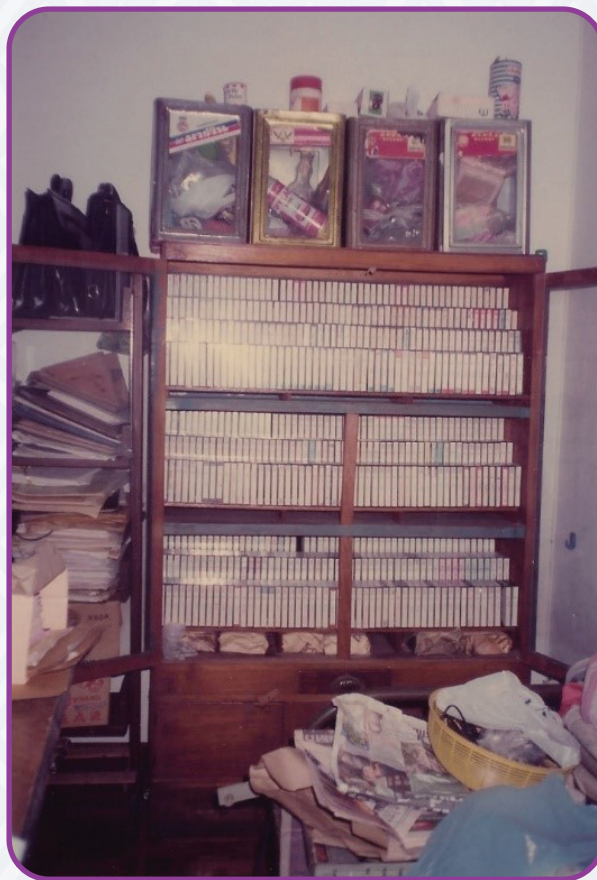
ภาพที่ ๑๔ ชั้นวางม้วนเทปเพลงไทยของครูบุญสม อินทาปัจ

“...บางทีก็ไม่ครบหรือเวลาไปเล่นออกงานหรือเล่นเฮฮาอะไรกัน แต่แกจะอัดทุกครั้ง ๆ แล้วสมัยก่อนจะมีพวกวิทยุ แกก็จะตีมพ์มาจากพวกวิทยุด้วย แล้วแกก็จะนั่งทำชิ้นที่บ้าน แล้วแกก็เรียงเป็นตบเลย แกก็จะเขียนรายละเอียดว่าอัดเมื่อไหร่ แล้วก็เรียง ๆ ไว้ ตอนแรกแกก็ไม่ได้คิดหรอกว่าจะมอบให้ทางราชภัฏหรืออะไร แกก็ทำไปเรื่อย ๆ ทีนี้พอถึงตอนแกป่วยหรืออะไรเนี่ยเราก็มารู้ช่วงนั้นก็คือไม่ค่อยได้ไปเล่นด้วย เพราะช่วงนั้น ก็พอดีงานที่ร้านก็เยอะ...” (เรื่องเดียวกัน)