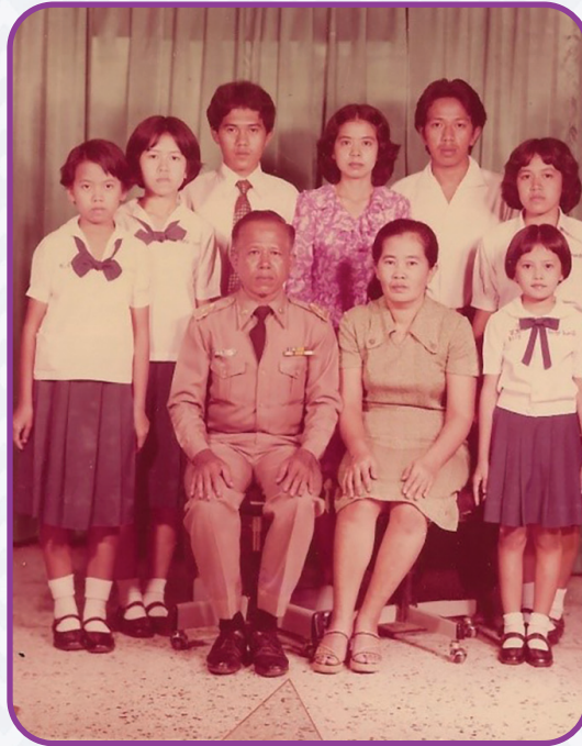
ภาพที่ ๔ ภาพครอบครัวอินทาบัจ และครอบครัว