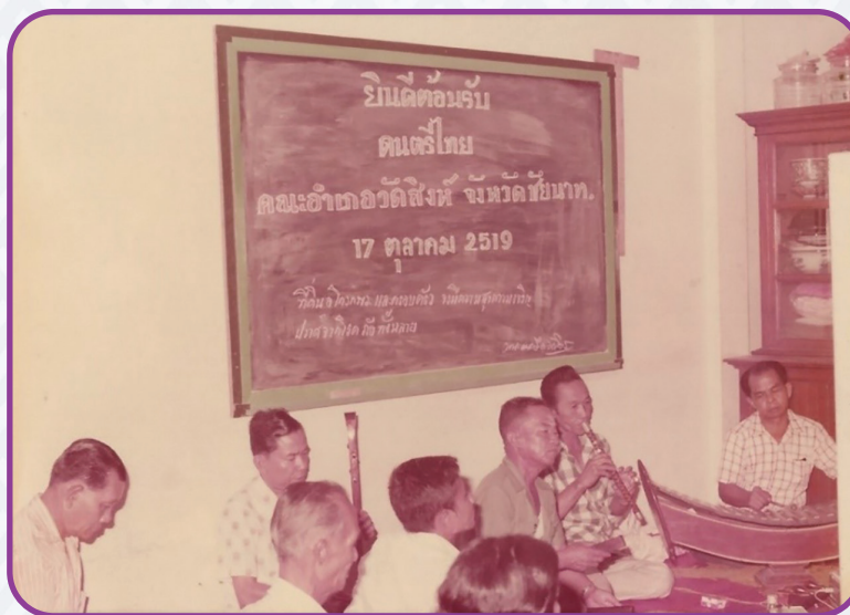
ภาพที่ ๕ ภาพถ่ายกระดานเขียนด้วยลายมือต้อนรับนักดนตรีจากคณะวัดสิงห์ จังหวัดชัยนาท

“...แล้วก็ลุงสมเนี่ยก็จะเป็นนักร้องอยู่คนเดียวสำหรับวงพวกปากน้ำโพ ที่นี้ก็ไม่มีใครจะเข้ เค้าก็รู้ว่าติดจะเข้ได้ก็มาตามไป มาตามไปก็เป็นสมาชิกอายุน้อยที่สุด คือ มาตามไปหมายความว่าเดือนนึงเค้าจะมีสังสรรค์เฮฮา กันก็คือตั้งวงเหล่านี้แหละ เมื่อก่อนนี่เค้าจะตั้งวงเหล้า นัดกันมากิน ส่วนมากก็จะ เป็นบ้านลุงสม บ้านลุงสมนี่ก็จะอยู่ตรง สมัยก่อนแกเช่าบ้านอยู่ตรงวัดกบ ถนจากป้อม ๑ ไป ก่อนจะถึงเขาหน้าเทศบาล บ้านแกก็จะอยู่ตรง มันจะเป็น ซอยที่มีโรงเรียน ท.๔ วัดกบ โรงเรียน ท.๔ หัวมุม แล้วก็ประตูวัดพอดิ แล้วก็ ตรงนี้เป็นตึกแถว แกเช่าตึกแถวตรงนี้อยู่มันก็จะกว้าง ก็นัดกินกันที่นี่ เสร็จแล้ว ก็ส่วนมากก็เป็นเครื่องสาย เพราะบางทีเค้าก็ขี้เกียจยก อย่างอาเชียรก็ขี้เกียจ ยกกระนาดไป ก็เลยเอาขิมไป แล้วก็รองไฟโรจน์ส่วนมากก็จะตีขิม หรือไม่ก็ ดีดออร์แกน แต่ออร์แกนแกก็ต้องทันสมัยหน่อย ยามาฮ่าไฟฟ้า เอาไปนั่งเล่นกัน แล้วก็จะมีวงที่เป็นพรรคพวกกันก็คือวงวัดสิงห์ ชัยนาท วัดสิงห์เนี่ยเค้าจะเป็น วงใหญ่ก็แก ๆ ทั้งนั้นเหมือนกัน แต่ละคนก็เคี้ยว ๆ ทั้งนั้น แล้วก็จะมีเดือนนี้ ชวนวัดสิงห์มา เดือนหน้าชวนวัดสิงห์ไปอะไรอย่างเนี่ย แต่ผมไม่เคยไป ถ้าวัดสิงห์มาเนี่ยก็คือเป็นวงใหญ่เลย มหิมา ก็กินกัน นั่งเล่นกัน...” (เรื่องเดียวกัน)